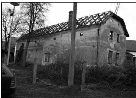
Situace před akcí