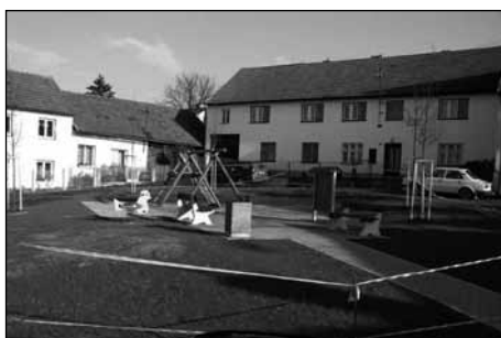
Situace po akci