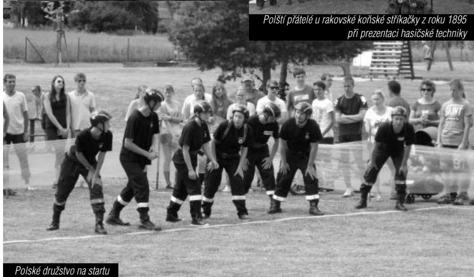
Polské družstvo na startu