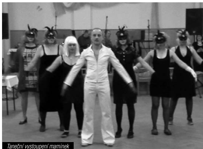
Taneční vystoupení maminek