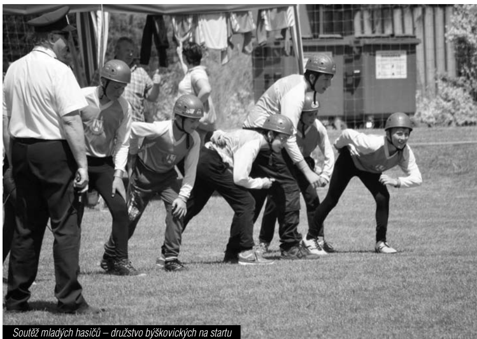
Soutěž mladých hasičů – družstvo býškovických na startu