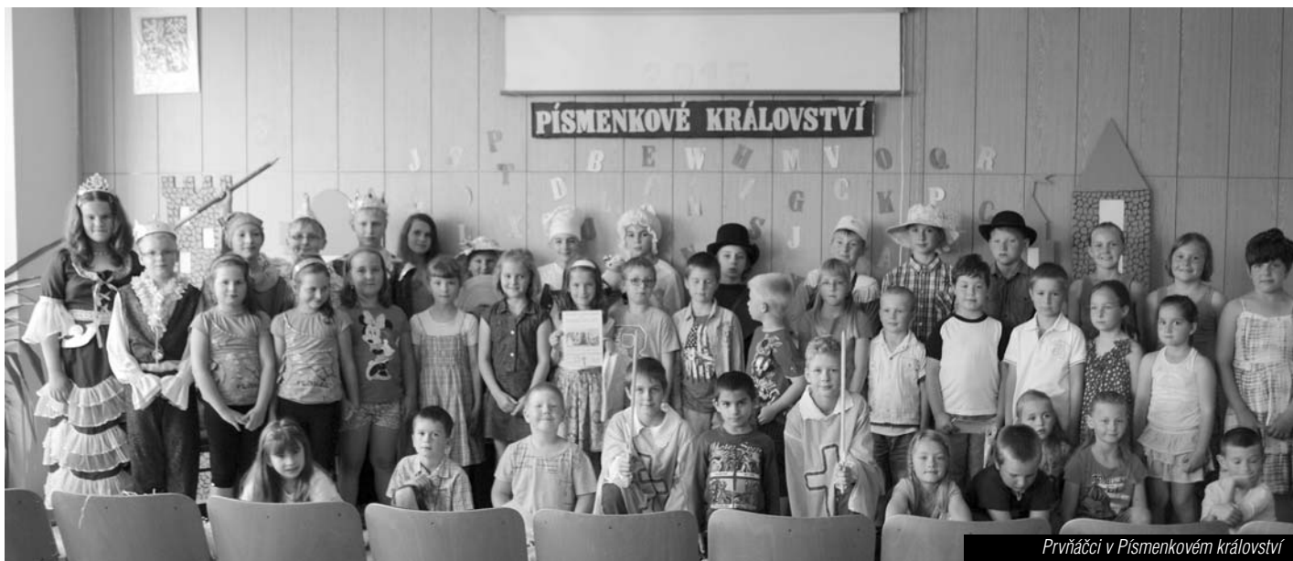
Prvňáčci v Pismenkovém království