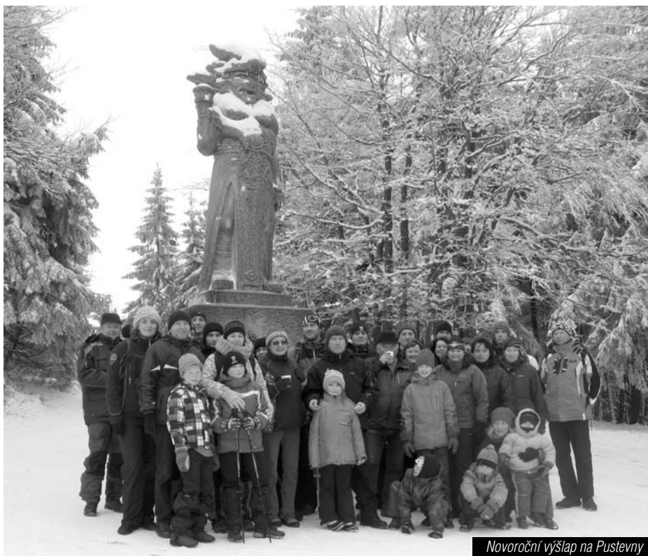
Novoroční výšlap na Pustevny

Zimní čas je současně časem plesů a večírků a ten sokolský se konal v sobotu 10. ledna. K poslechu a tanci zahrála skupina Alex, která svou hudbou rozproudila nejednoho tanečníka. A o kulturní zpestření se postaraly děti ze ZUŠ Hranice, které předvedly opravdu nápadité taneční vystoupení. Nejdříve se předvedly děti mladší, které na oblíbenou hudbu z Pomády předvedly zábavné a živelné vystoupení a pak o trochu později nastou-