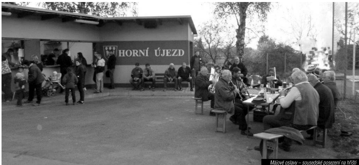
Májové oslavy – sousedské posezení na hřišti