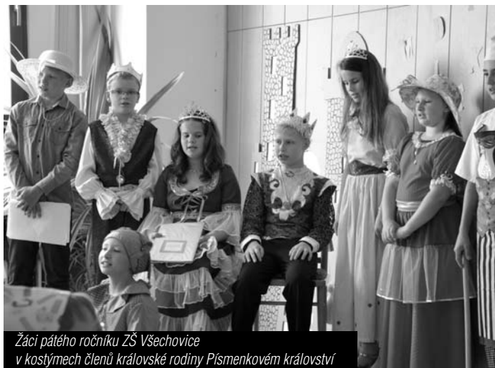
Žáci pátého ročníku ZŠ Všechnovice v kostýmech členů královské rodiny Pismenkovém království