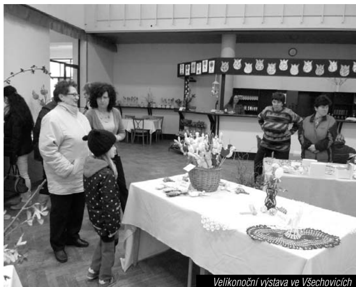
Velikonoční výstava ve Všehovicích