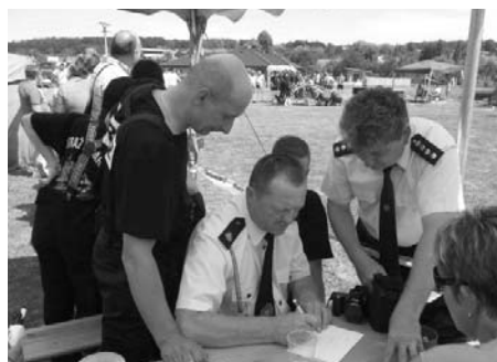
Naši a polští hasiči se domlouvají na další společné spolupráci