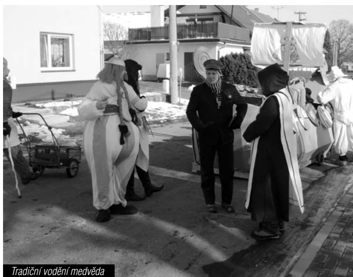
Tradiční vodění medvěda