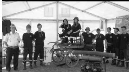
Polští přátelé u rakovské koňské stříkačky z roku 1895 při prezentaci hasičské techniky