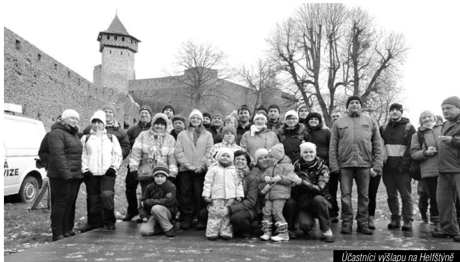
Účastníci výšlapu na Helfštýně

Tento turnaj byl výjimečný i tím, že se do organizace zapojila místní knihovna. Ta vymyslela pro tři věkové kategorie pohádkový kvíz, který omla-