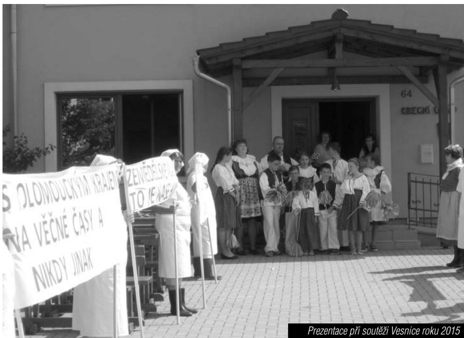
Prezentace při soutěži Vesnice roku 2015