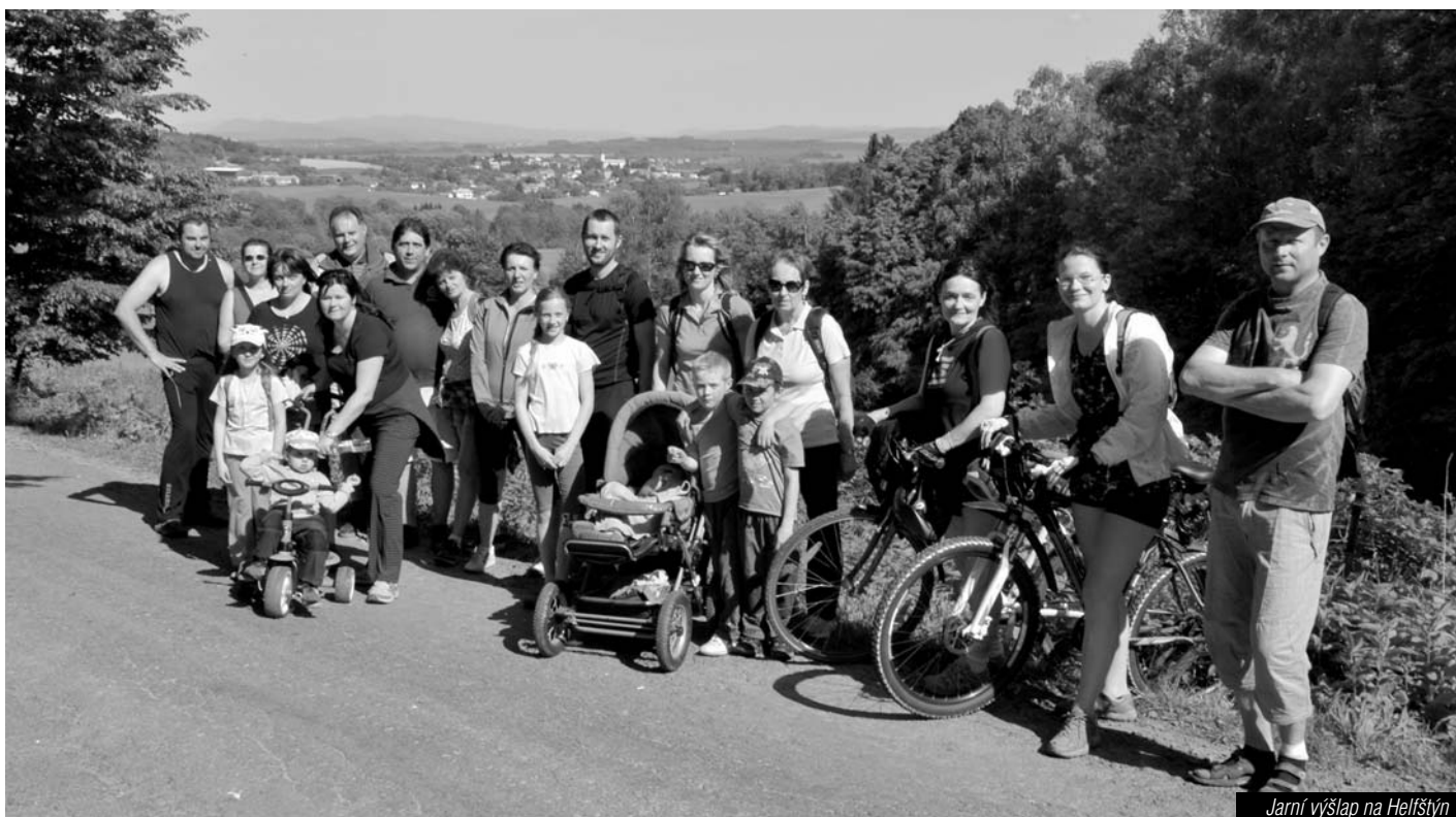
Jarní výšlap na Helfštýn

Důležitou akcí pro některé skalní příznivce sokolské činnosti v Paršovicích je účast některých členů na Gymnaestrádě v Helsinkách ve Fin-