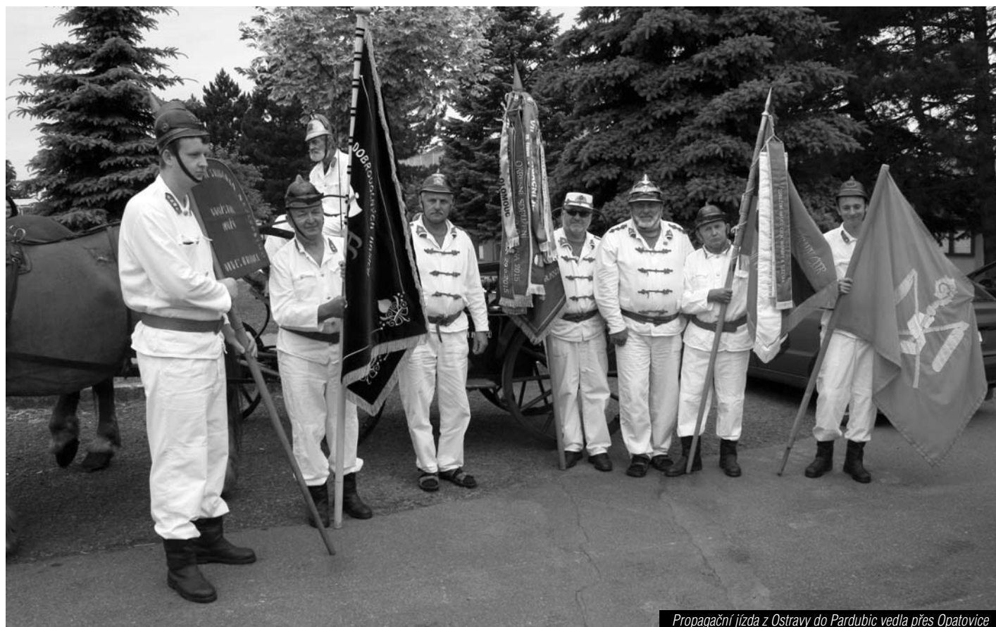
Propagační jízda z Ostravy do Pardubic vedla přes Opatovice

Soutěž dospělých s názvem O pohár zastupitelstva obce Opatovice jsme uspořádali 13. června. Na výborně připravené trati předvedlo své výkony 18 družstev mužů, 11 družstev žen, v kategorii „nad 35 let“ se představily tři týmy mužů a jeden tým žen. Mužskou kategorii ovládlo v čase 17,32 družstvo z Kunovic, následováno jen těsně druhou Mladcovou a třetí Radkovou Lhotou. Domácím se útok příliš nevyvedl a za čas 21,68 brali až jedenácté místo. V přestávce před kategorií žen se ukázali i ti dříve narození hasiči. V kategorii „nad 35“ zvítězilo družstvo hasičů z Valšovic, na druhém místě se umístily ženy z Opatovic, které dokázaly srazit terče