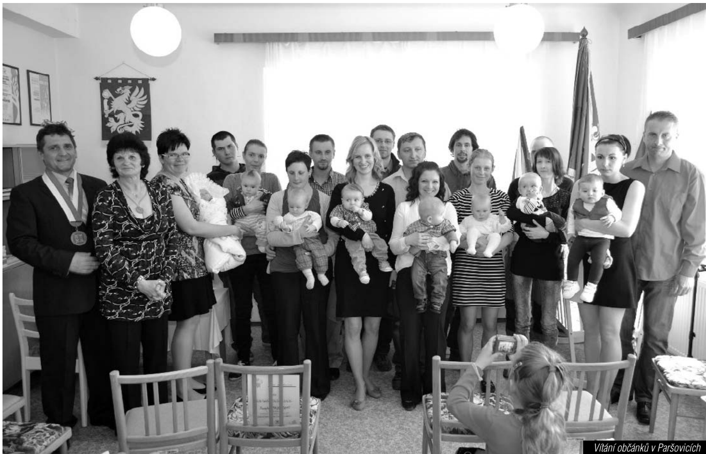
Vítání občanky v Paršovicích

V dubnu jsme do Paršovic přivítali nové občanky – dvě děvčátka a šest chlapečků. Poslední pátek v květnu se v našem farním kostele svatě Markéty, stejně jako v řadě dalších v naší republice i celé Evropě, konala již potřetí