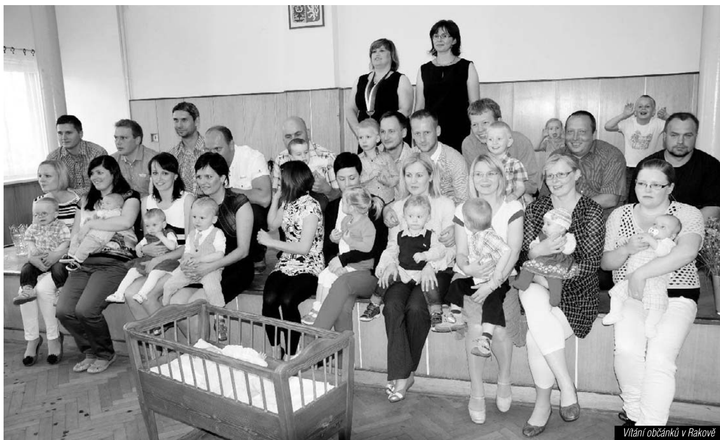
Vítání občánků v Rakově