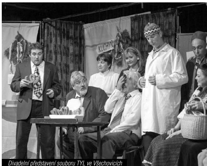
Divadelní představení souboru TYL ve Všehovicích

Na své si přišli i naši nejmenší. Ti se mohli potěšit živými zvířátky a zabavit malováním. Ty zručnější pohlítilo sypání mandal a obrázků z barevných