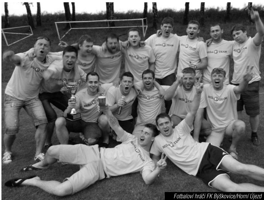
Fotbaloví hráči FK Býškovice/Horní Újezd