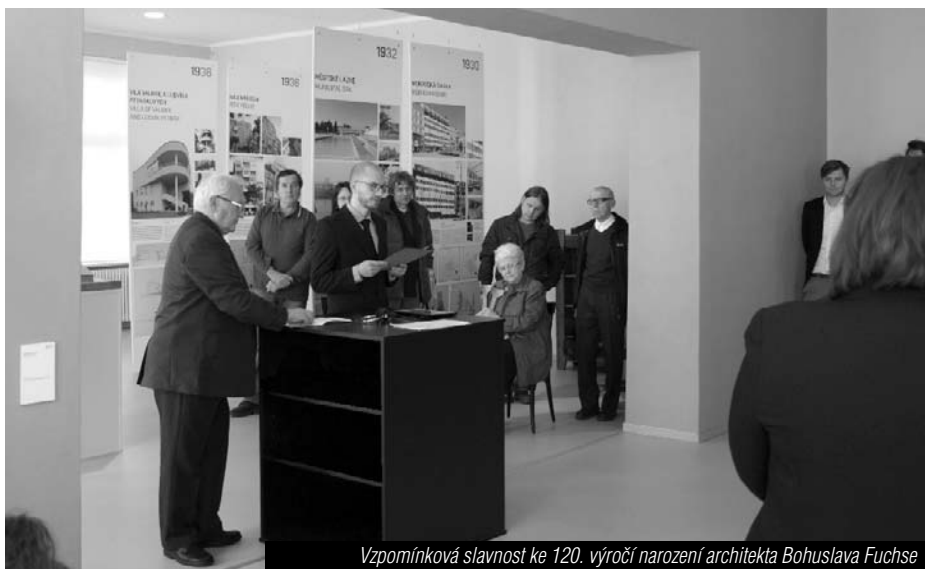
Vzpomínková slavnost ke 120. výročí narození architekta Bohuslava Fuchse