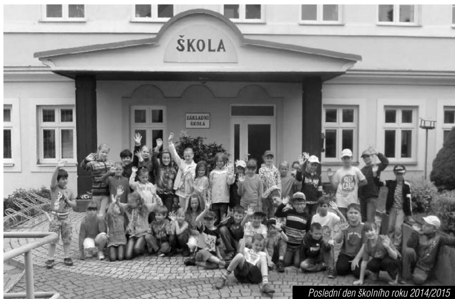
Poslední den školního roku 2014/2015