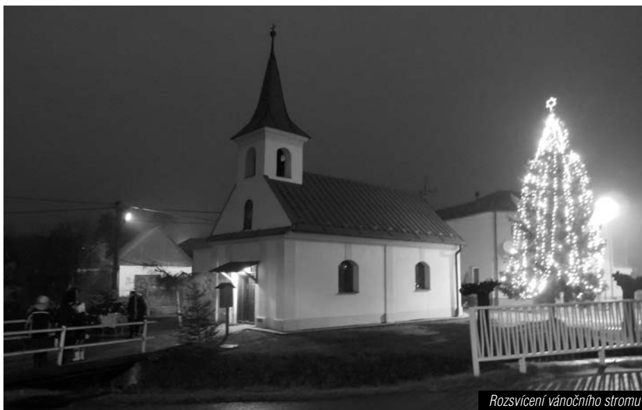
Rozsvícení vánočního stromu

Starosta obce pozval místní občany na společný novoroční příděk na hřišti TJ s tím, že by