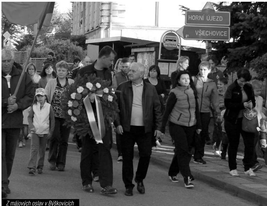
Z májových oslav v Býškovcích

Dne 7. června se v areálu TJ v Býškovcích uskutečnil druhý ročník dětské hasičské soutěže „O pohár starosty SDH Býškovice“. Soutěž byla zařazena do VC OSH v Přerově a celkem se zde do bojů zapojilo 31 soutěžních družstev mládeže, z toho 13 starších a 18 mladších družstev. Počasí stejně jako loni bylo moudré a sluníčko vítalo všechny účastníky již od rána. I přes velmi teplé počasí podávaly všechny soutěžní kolek-