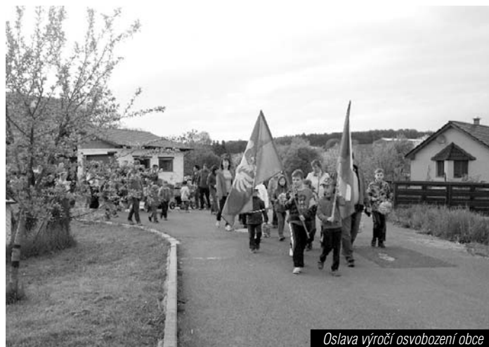
Oslava výročí osvobození obce