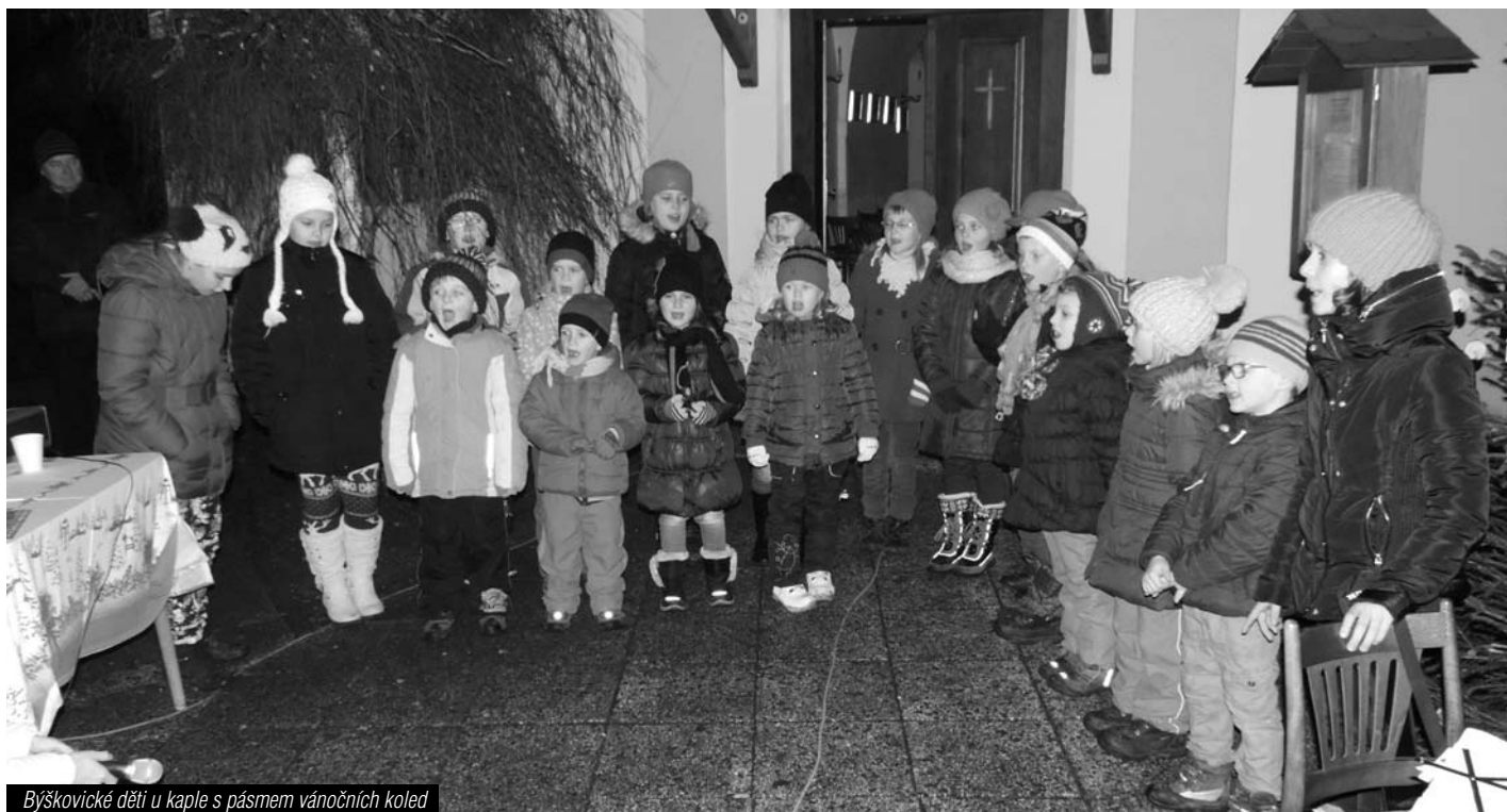
Býškovické děti u kaple s pásmem vánočních koled