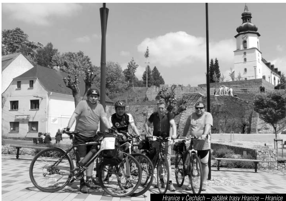
Hranice v Čechách – začátek trasy Hranice – Hranice