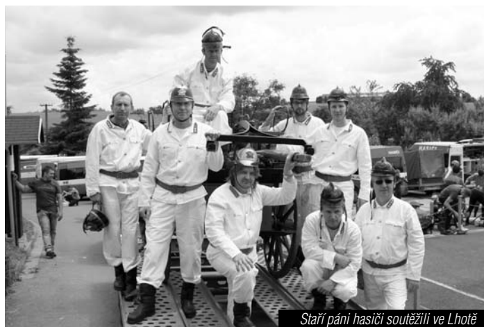
Starší páni hasiči soutěžili v Lhotě

synchronizovanému plaveckému vystoupení na suchu. Zejména mužské oko pak potěšilo předvedení kankánu v podání děvčat z Běltořina. SDH Opatovice tímto děkuje všem sponzorům za jejich ceny do tomboly, návštěvníkům plesu za hojnou účast a skvělé kapele Blue Band Company za hudební doprovod.