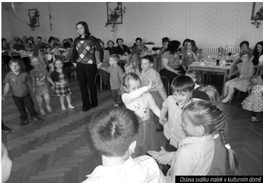
Oslava svátku matek v kulturním domě