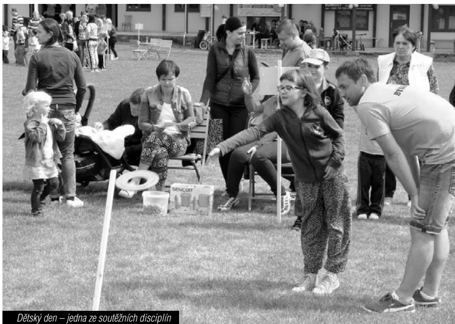
Dětský den – jedna ze soutěžních disciplín

tivy skvělé výkony. Jistě k dobrým výkonům přispěl i připravený bazén k osvěžení v průběhu soutěže. Po čtyřhodinovém zápolení byly známy výsledky. V kategorii mladších žáků se na 3. místě umístilo sousední družstvo z Opatovic v čase 19,50 s, na místě druhém skončila Střítež nad Ludinou v čase 18,00 s a prvenství v této kategorii patřilo mladším žákům z Partutovic a to časem 17,31 s. V kategorii starších skončila na 3. místě Velká v čase 14,79 s, na druhém skončila Střítež nad Ludinou v čase 14,62 s a první místo si odvezli starší žáci z Potštátu, kteří dominovali časem 14,06 s. Do soutěžních bojů se zapojili i místní mladí hasiči, kteří pro letošní rok připravili dvě nová družstva, mladší družstvo se umístilo na 10. místě (23,14 s) a starší družstvo na 6. místě (16,45 s). Sbor dobrovolných hasičů by i touto cestou chtěl poděkovat všem účastníkům, příznivcům, pořadatelům, ale i sponzorům, protože bez nich by se taková akce nedala uspořádat. A nyní nezbyvá než se těšit, že se příští rok opět setkáme a zasoutěžíme si.