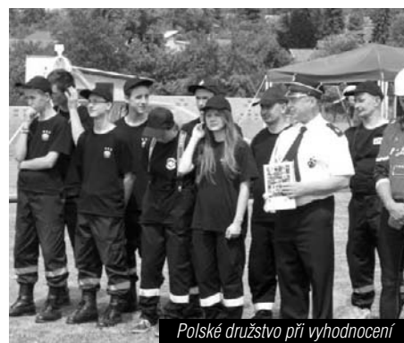
Polské družstvo při vyhodnocení

Již na samotné akci se pak začali hasiči z obou států domlouvat na dalších společných setkáních, což svědčí o tom, že naše realizované česko-polské projekty stojí za to a přispívají k prohloubení našeho vzájemného přátelství. PK