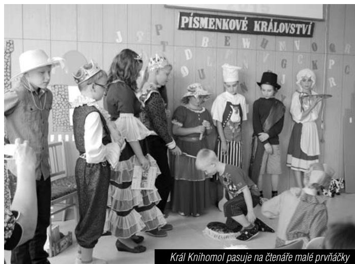
Král Knihomol pasuje na čtenáře malé prvňáčky