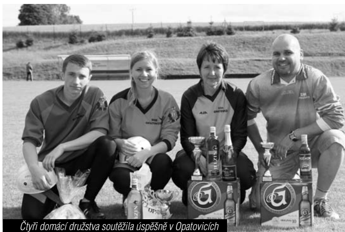
Čtyři domácí družstva soutěžila úspěšně v Opatovicích