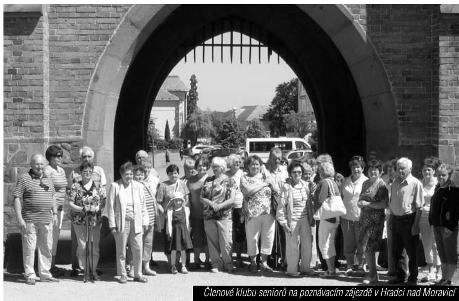
Členové klubu seniorů na poznávacím zájezdě v Hradci nad Moravicí

V pátek 5. června 2015 se vydalo 46 členů na poznávací zájezd do Hradce nad Moravicí a arboreta Nový Dvůr. První návštěva patřila státnímu zámku v Hradci nad Moravicí. Samotné město je vstupní bránou do malebného údolí řeky Moravice. Dominantu tvoří komplex Bílého a Červeného zámku spolu s přilehlým rozsáhlým parkem. Do září 1979, kdy byl z důvodu celkové památkové obnovy uzavřen, jím prošly téměř 2 mil. návštěvníků. Od roku 1996 byl znovu zpřístupněn a zámecké interiéry tzv. Bílého zámku se postupně znovu otevírají svým návštěvníkům. Zámecké dějiny jsou poznamenány především pobyty slavných hudebníků, např. Ludviga van Beethovena, Nikoly Paganiniho a Ference Liszta. Majitelé zámku manželé Lichnowští se dále na zámku setkávali např. se spisovatelem Markem Twainem či malíři Pablom Picassem a Oskarem Kokoškou. Se svými 130 ha je zámecký park největším zámeckým areálem v Moravskoslezském kraji. Od roku 1962 je místem, kde se koná hudební interpretační soutěž Beethovenův Hradec. Po prohlídce a dobrém obědě nás cesta vedla dále směrem na Nový Dvůr u Opavy, kde se nachází na ploše