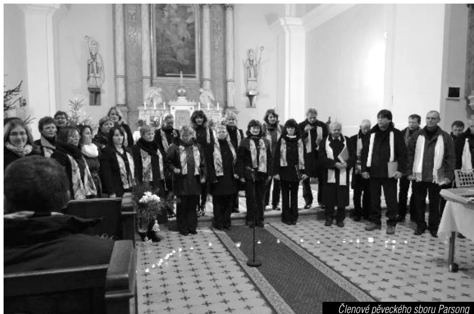
Členové pěveckého sboru Parsong

lým a vítaným paršovským občanem. Tento pěvecký sbor čítá kolem 20 stálých členů, kteří jsou nejen z obce Paršovice, ale i z nedalekých obcí a přispívají tak svým hlasem do našeho souboru. Co se týče aktivity sboru, zkoušky probíhají každou středu na místním obecním úřadě a to co nazkoušíme, jsme schopni prezentovat na různých kulturních vystoupeních. Dvakrát do roka jezdíme na pěvecké soustředění do nedalekých Rajnochovic, kde pilně zkoušíme a pilujeme hlavně písně, které pak prezentujeme veřejně. Ačkoli je záběr našeho repertoáru široký, na kvalitě neubírá. Vyvrcholením našeho snažení je pak vánoční koncert, který v letošním roce bude už druhý v pořadí. Loňský měl takový úspěch, že jsme si dali za cíl tuto tradici dodržet stůj co stůj. Koncert se konal v kostele v čase vánočním a vystoupení členů Parsongu obohatily i místní děti, jejichž zpěv byl zdařilým výkonem malých předskokanů. To že v roce letošním budou vystupovat opět s námi, je už více než samozřejmostí. V letošním roce však sbor vystupoval i na jiných kulturních akcích, na jaře na Dni matek, na oslavách výročí osvobození 8. května, kde Parsong zazpíval Českou hymnu. Pozor, tento sbor neustále nabírá i další nové členy, jsme nejen kruh spřátelených, dobře se bavících lidí, ale i sbor, kterému citelně chybí hlavně basisté