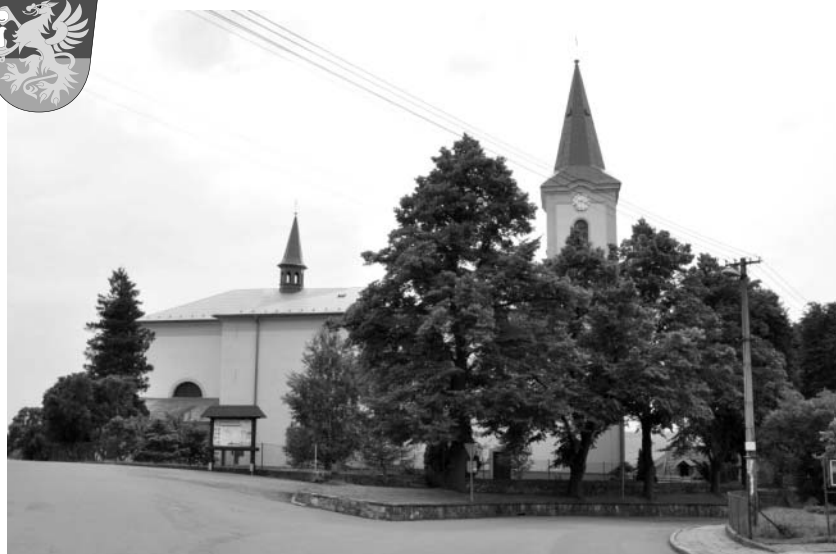
Kostel sv. Markéty v Paršovicích

dování komunikace k budoucímu víceúčelovému hřišti a nové základny pro hasiče, potřebné ke konání soutěží. Komunikací k sedmi rodinným domkům, výměnu oken a fasádu na víceúčelové budově obecního úřadu, jsme budovali za příspěví dotací Programu obnovy venkova Olomouckého kraje. Taktéž jsme nezapomněli