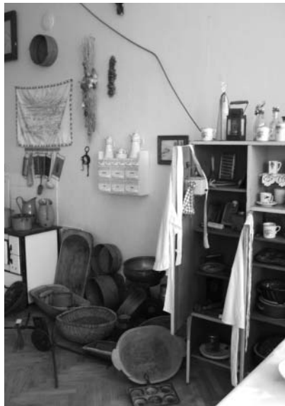
Stálá expozice „Jak se žilo v Ójezdě“