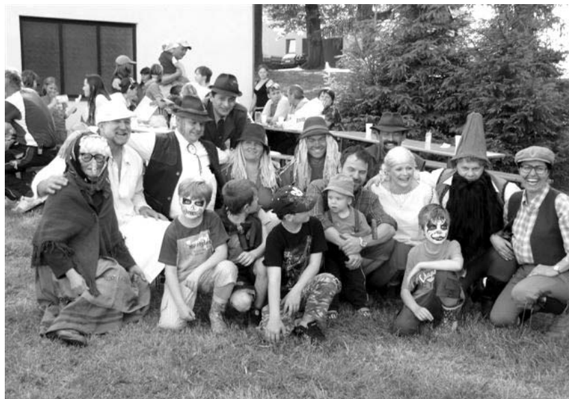
Akce pro děti s názvem „Pohádkový les“

Obec také pomáhá aktivně politice zaměstna-