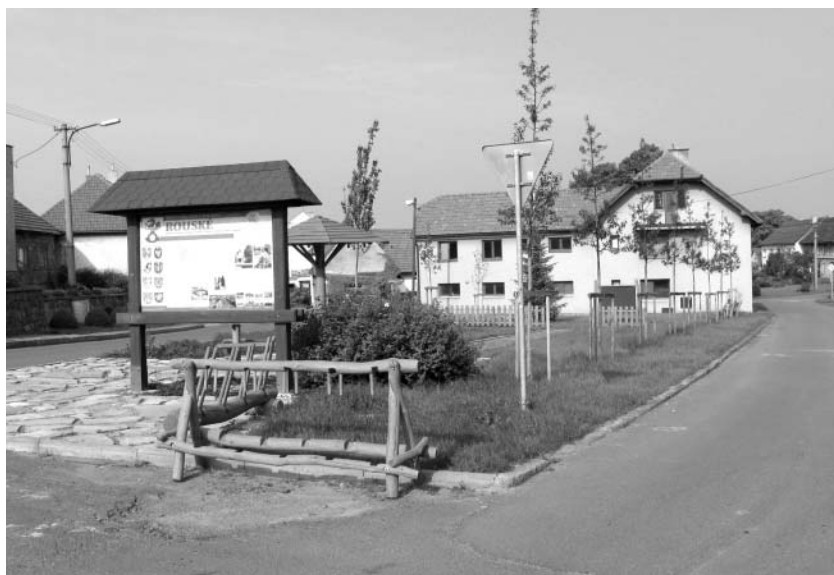
Veřejné prostranství Rozárka v obci Rouské

V oblasti bezpečnosti bylo kompletně vyměněno a doplněno dopravní značení místních komunikací a většina obecních objektů byla