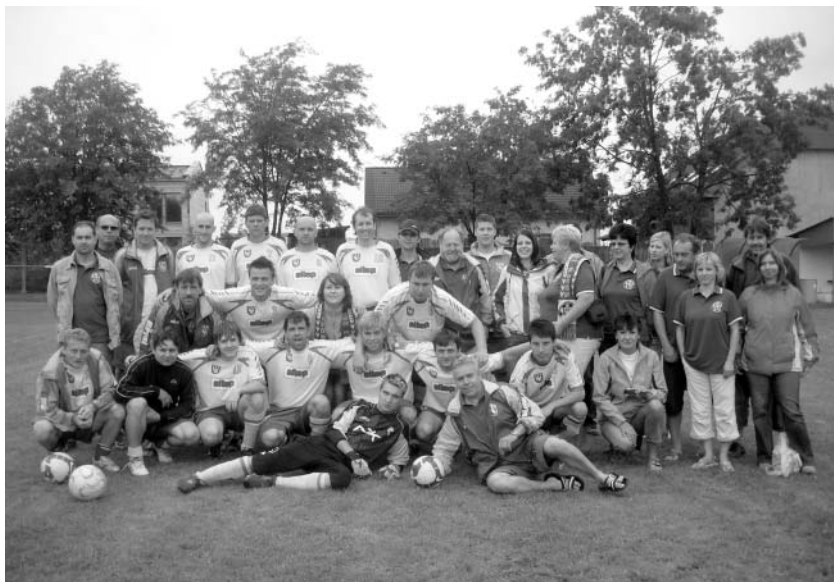
Turnaj Újezdů v obci Pletený Újezd u Kladna 2010

O tom, že je „Ójezd, Ójezd, pěkná dědina...“ (jak se zpívá v naší hymně z r. 1966), se můžete přesvědčit při návštěvě naší obce nebo na Mikroregionální olympiádě, která se koná 21. srpna 2010 na hřišti v Horním Újezdě.