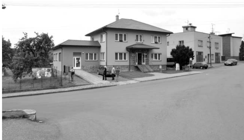
Budova obecního úřadu v Paršovicích