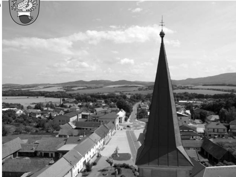
Pohled na obec z kostelní věže

V roce 2007 a po té v roce 2009 jsme provedli dvě etapy rekonstrukce a obnovy budovy základní školy. Pětipavilónový objekt školy byl postaven v roce 1984. Bohužel byly při stavbě použity technologie poplatné tehdejší době.