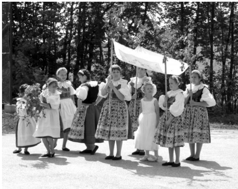
Býškovický klásek při vystoupení na II. Býškovických letnicích

Pokud jde o nemovité kulturní hodnoty, podařilo se obci Býškovice opravit dva kříže odbornými kameníky a opravit fasádu kapličky s odvodněním budovy, znovuizolováním