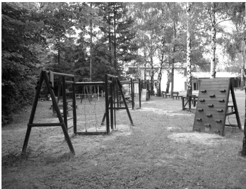
Dětské hřiště u venkovního areálu v Provodovicích