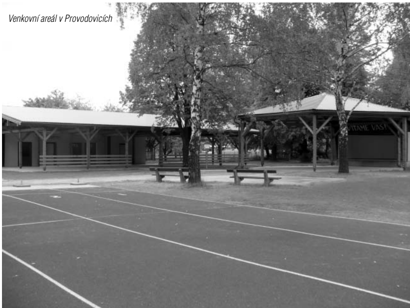
Venkovní areál v Provodovicích