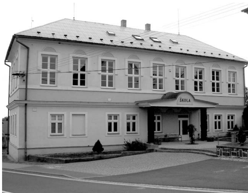
Budova ZŠ s novými okny

Ne vše se však podařilo vyřídit ke spokojenosti našich občanů. Trápí nás např.: vzhled nemovitostí čp. 28 a 33, které jsou delší dobu nevyužitelné. Jednání obce s vlastníky nemovitostí bylo