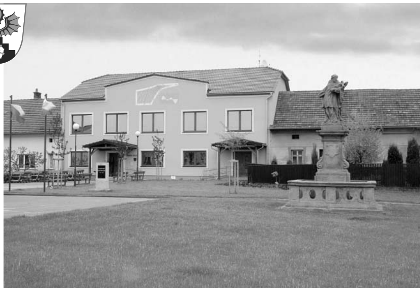
Víceúčelový dům na rousecké návsi