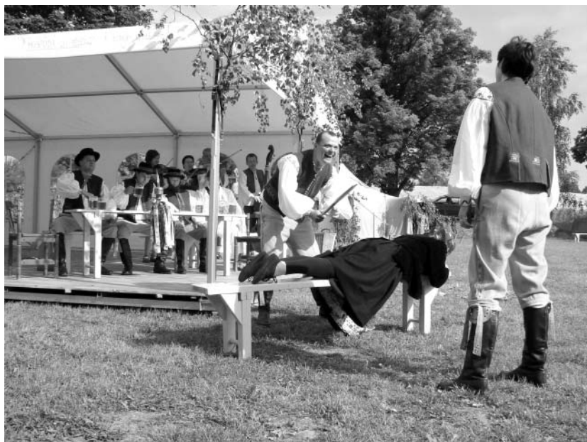
Záhorské právo v rámci Býškovických Letnic

Také se již těšíme na letošní moped-cup Záhorská střela, který nás v brzké době oče-