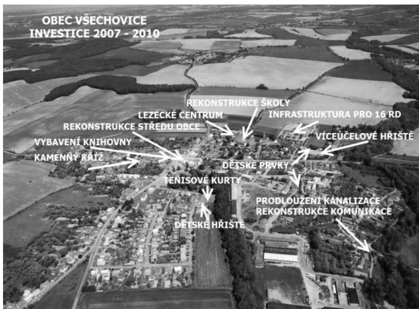
Zrealizované investice ve Všechnovicích

Mikroregion Záhoran byl úspěšný s projektem Středisko služeb venkovu II z Programu obnovy venkova Olomouckého kraje 2010, v rámci kterého si každá obec bude moci poříditi techniku na její údržbu. Celková výše dotace je 472 000 Kč pro všech 9 obcí. Do konce roku 2010 tak budou v mikroregionu jezdit nové traktorky, sekačky či jiná technika, kterou si však obce budou muset dofinancovat z vlastních zdrojů.