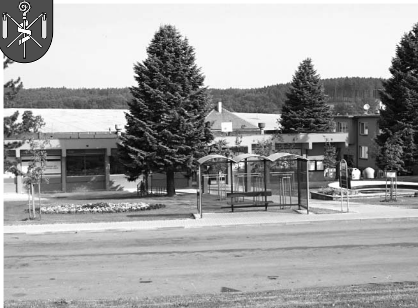
Náves v Opatovicích

čekárna. V návaznosti na tuto akci proběhla v roce 2009 zásadní úprava veřejné zeleně v obci (evropská dotace Leader ČR) a také oprava podstatné části sakrálních staveb ve středu obce (dotace Ministerstvo pro místní rozvoj ČR). Obec tak získala novou tvář, která jistě přispěla k jejímu lepšímu vzhledu. V roce 2009 byla dále