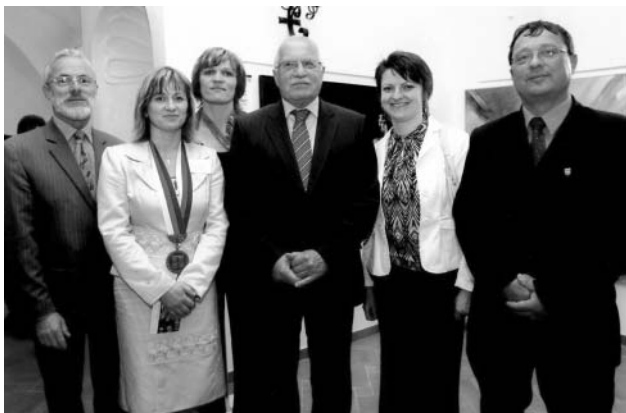
Zástupci mikroregionu Záhoran měli tu čest pozdravit dne 16. 6. 2010 v Hustopečích nad Bečvou pana prezidenta ČR Václava Klause