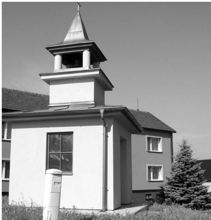
Obnovená zvonice v Rakově

V letošním roce byla dokončena realizace projektu „Obnova sakrálních staveb v obci Rakov“, na který jsme získali evropskou dotaci z Programu rozvoje venkova ve výši 434.561 Kč, spoluúčast obce 59.259 Kč. Jednalo se o opravu zvonice a dvou křížů, a to v místních částech Vrchbrána a Benátky. Tento projekt byl ukončen k datu 30. dubna letošního roku. Dalšími letos realizovanými projekty jsou „Obnova vyletiště“, na jejíž realizaci jsme získali dotaci z Programu rozvoje venkova – Leader ve výši 545.041 Kč, dofinancování obce 261.909 Kč. Tento projekt bude ukončen k 30. září letošního roku. Dále pak dotace z programu Program obnovy venkova Ministerstva pro místní rozvoj ČR na realizaci projektu „Rakov – spolkové centrum pro děti a mládež“ – oprava sociálního zařízení KD, oprava a vybavení knihovny a klubovna v KD. Získaná dotace ve výši 282.000 Kč spoluúčast obce 122.000 Kč. Dalším letos realizovaným projektem je „Obnova obecní budovy určené pro spolkové aktivity“. Jedná se o opravu střechy kulturního domu. Dotace na realizaci tohoto projektu byla přidělena z Programu obnovy venkova 2010 Olomouckého kraje ve výši 459.000 Kč, spoluúčast obce 306.000 Kč. Posledním provedeným projektem v naší obci v letošním roce by měla být „Infrastruktura Doubravka“ – inženýrské sítě. K realizaci tohoto projektu byla získána dotace z Ministerstva pro místní rozvoj ČR ve výši 450.000 Kč. Pro-